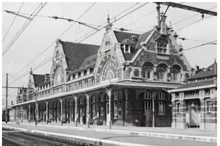
Station Ciney (Ref. Z03689)

Comme de nombreuses lignes secondaires, la ligne voit son trafic de voyageurs chuter au début des "Golden sixties" et le 10 novembre 1962, le dernier autorail, le 4922, circula de Statte à Ciney. La ligne est ensuite progressivement fermée, faute de trafic de marchandises. La section Marchin - Clavier d'abord, en 1965, puis de Clavier à Hamois-en-Condroz en 1973 et de Hamois-en-Condroz à Ciney le 6 décembre 1982. De cette ligne, seule la section Statte - Marchin est encore toujours utilisée (exploitation simplifiée - 40 km/h). Pour des motifs stratégiques, comme pour les lignes 127 et 128, l'assiette ne sera toutefois pas déferrée immédiatement. Un entretien minimal sera assuré par l'armée. Cette convention d'entretien par l'armée belge durera jusqu'en 1992.