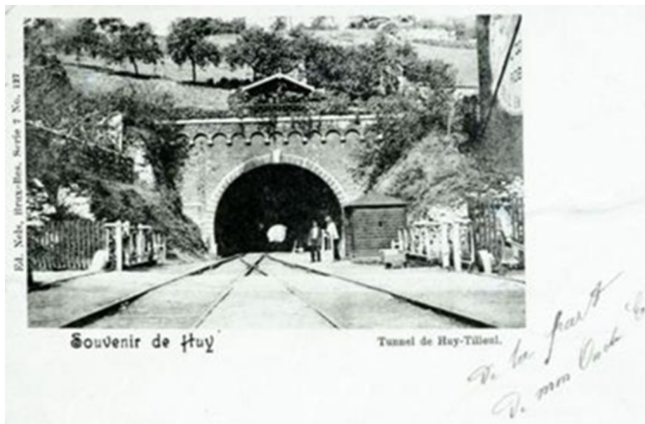
Carte postale du tunnel ferroviaire de Huy-Tilleul (Réf. Z00452)

La ligne 126 relie Statte à Ciney, en traversant le Condroz via les vallées du Hoyoux et du Bocq.