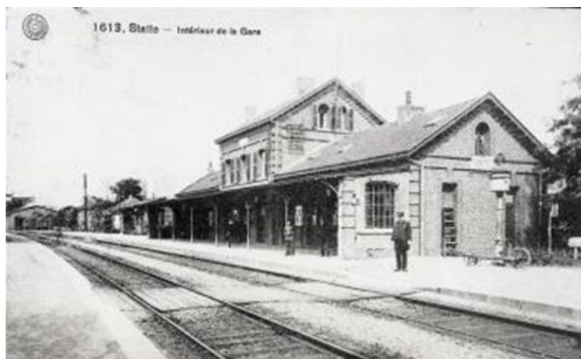
Carte postale de la gare de Statte (Réf. Z00322)